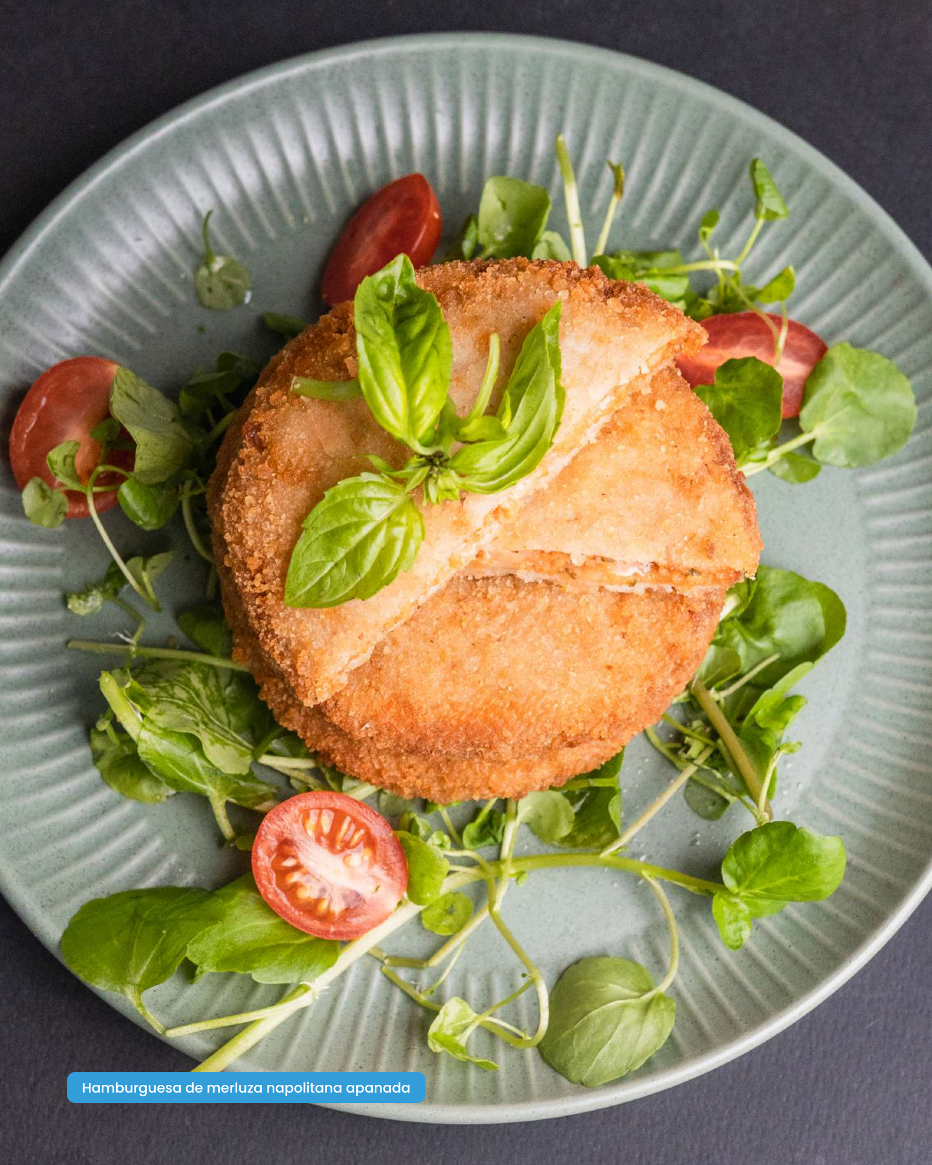
Hamburguesa de merluza napolitana apanada